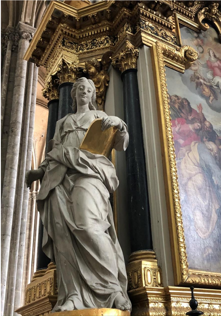
Maria Magdalena in Amiens