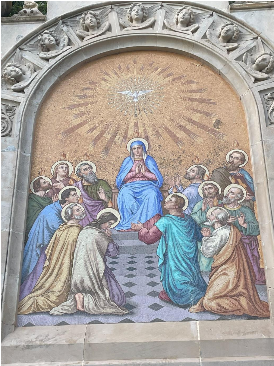
Montserrat, aan de weg naar de Santa Cova.