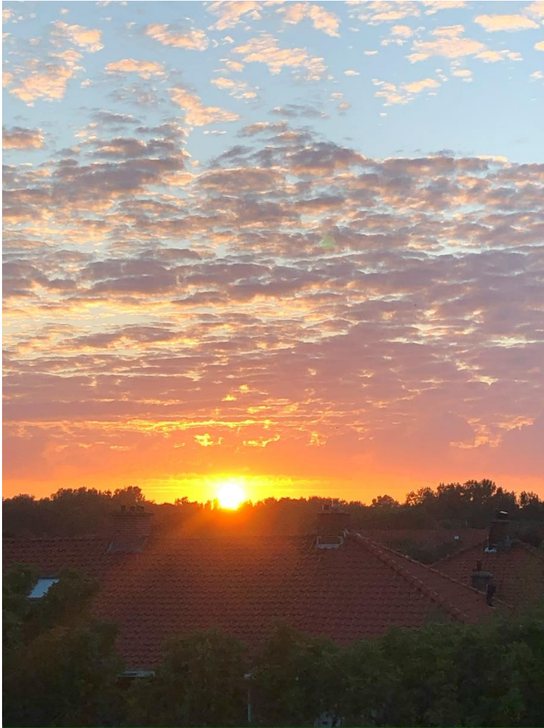
Montreal, Aude, Katharenland