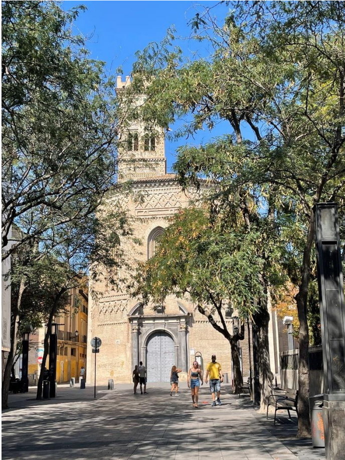
Maria Magdalena kerk in Zaragoza