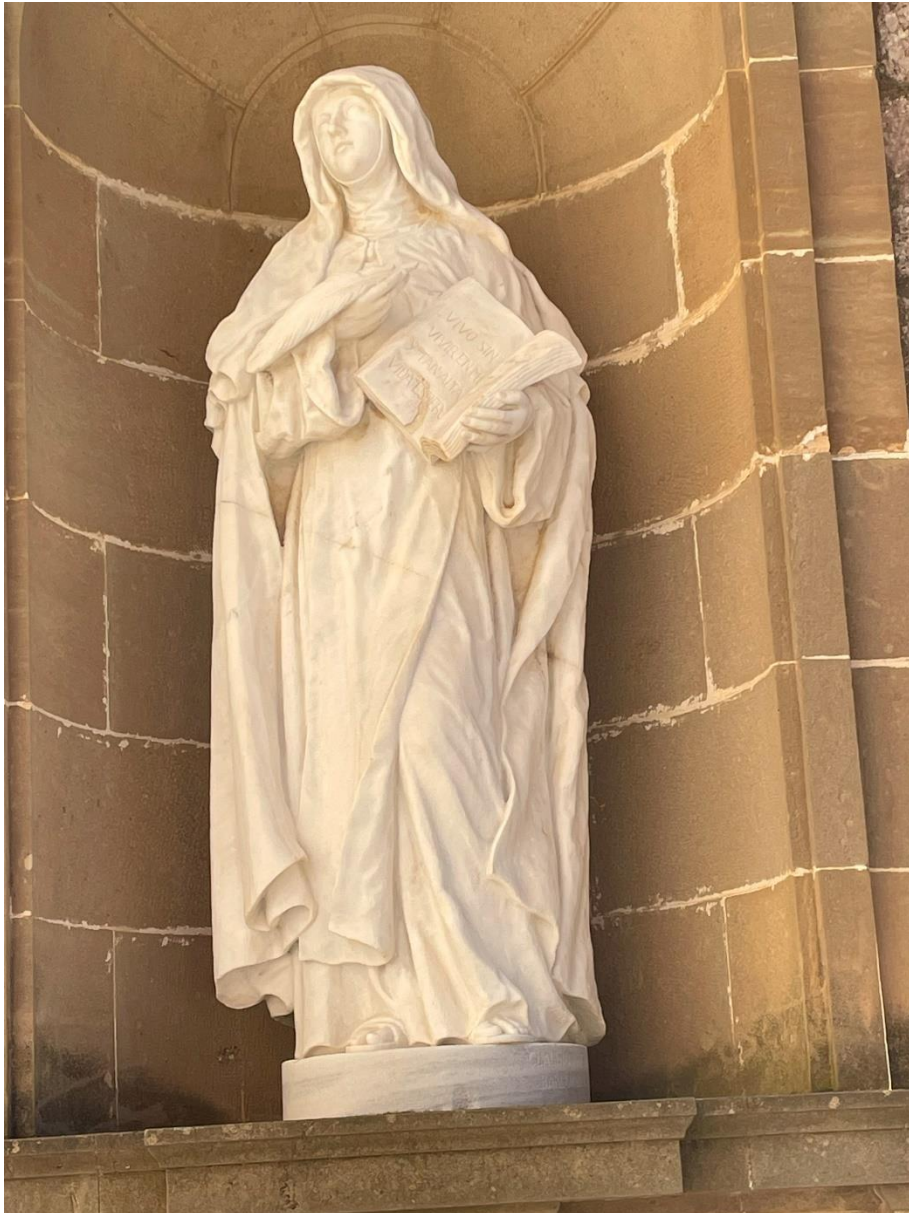
Montserrat, op het voorplein van de Basiliek