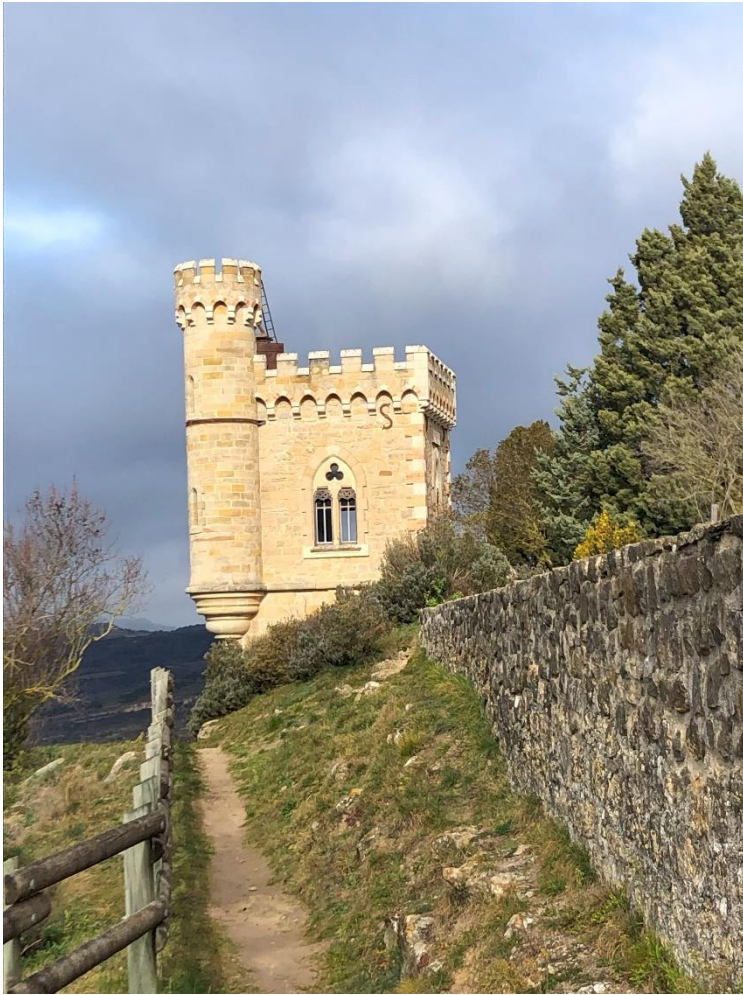
Magdala (toren) in Rennes le Chateau