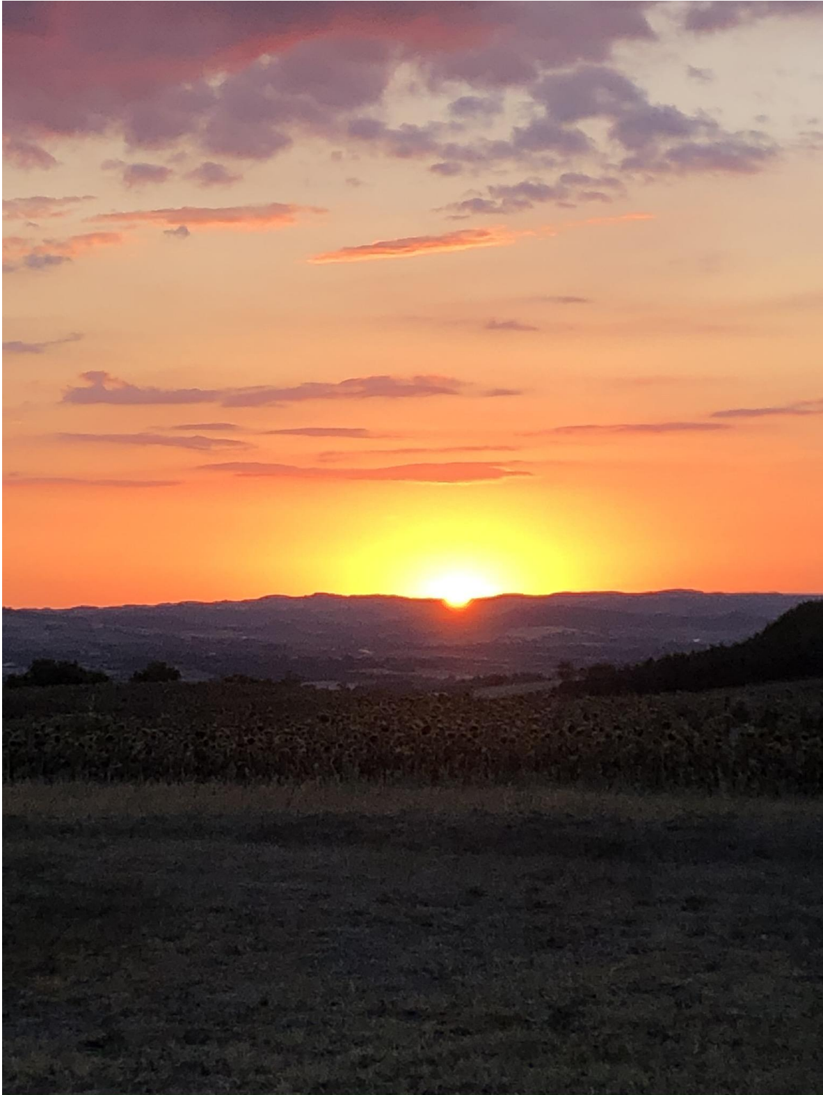
De Aude, Zuid Frankrijk